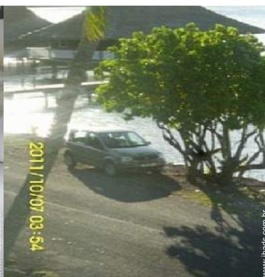
aluguer de veículos