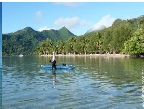
vista sobre o mar