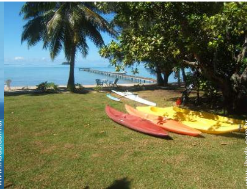
Equipamentos de lazer