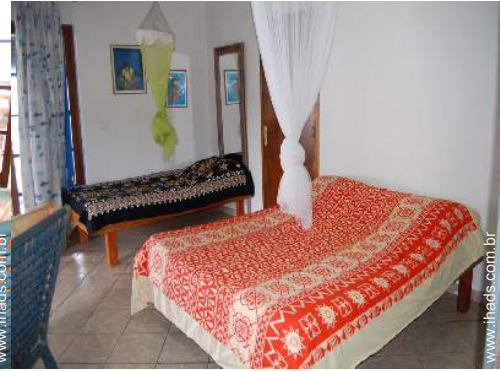
Dormida - cama(s)