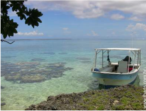
barco a motor