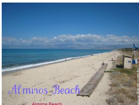
praia de seixos