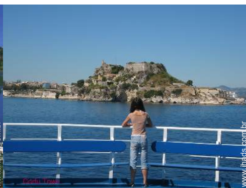
centro da cidade