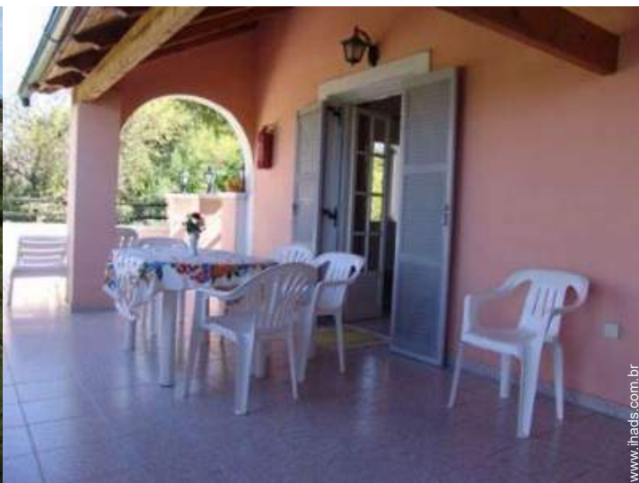
mesa(s) de jardim