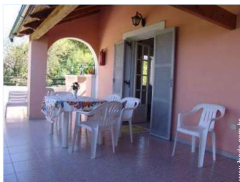
mesa(s) de jardim