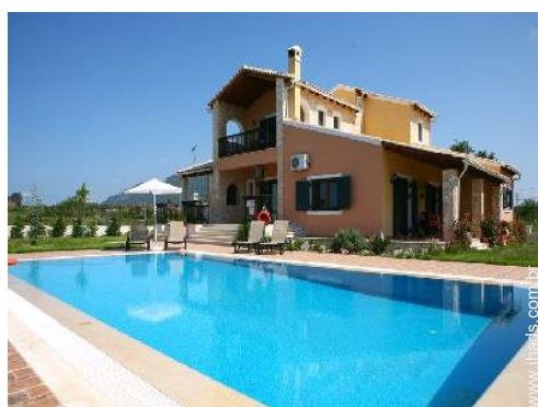
Vivenda de Luxo