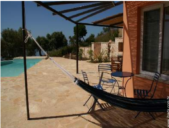
cama de rede