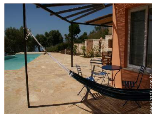
cama de rede