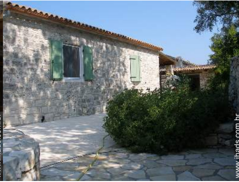
vista de pátio