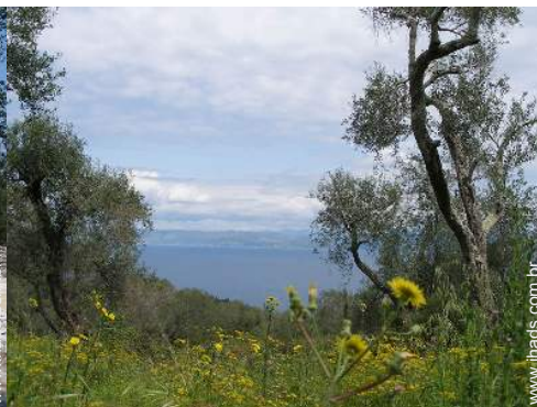
vista de campo