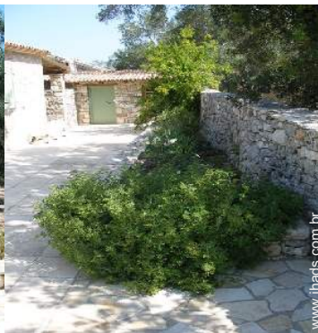
vista de pátio