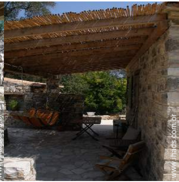
cama de rede