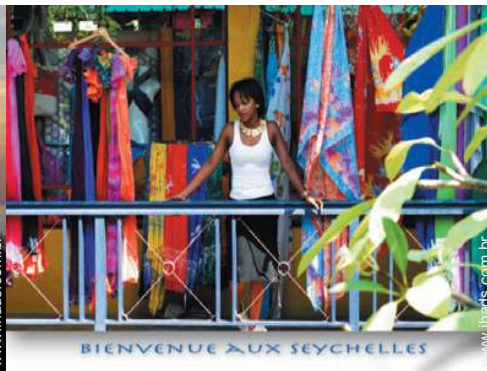
loja de artesanato