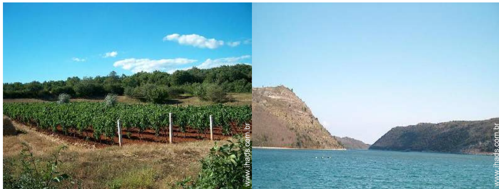
vista sobre vinhas