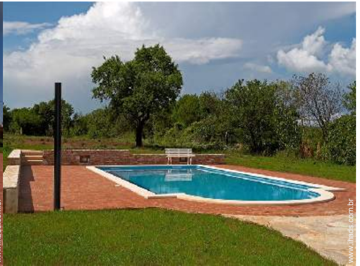
vista para pradaria