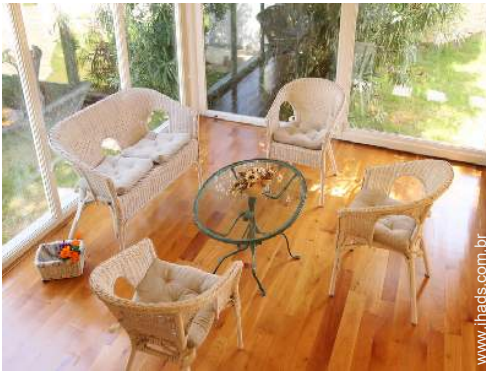
Conforto interior à disposição dos hóspedes