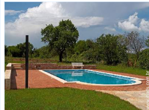
vista para pradaria