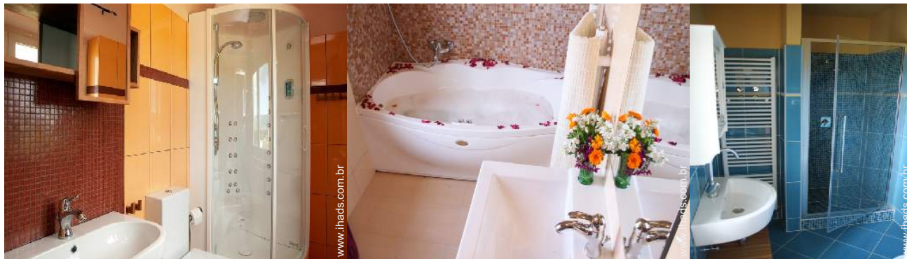
Conforto interior à disposição dos hóspedes