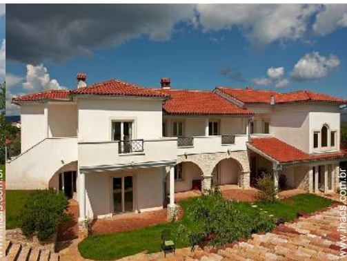
vista a partir do terraço coberto