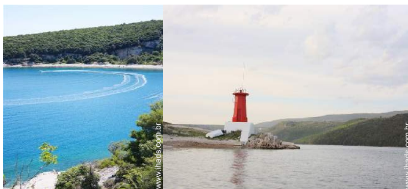
barco a motor