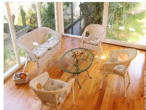
Conforto interior à disposição dos hóspedes

Cozinha exterior, salão de verão, forno para pizza, barbecue, mesa(s) de jardim, 10 cadeira(s) de jardim, guarda-sol, salão de jardim, 10 espreguiçadeira(s), duche exterior, WC exterior