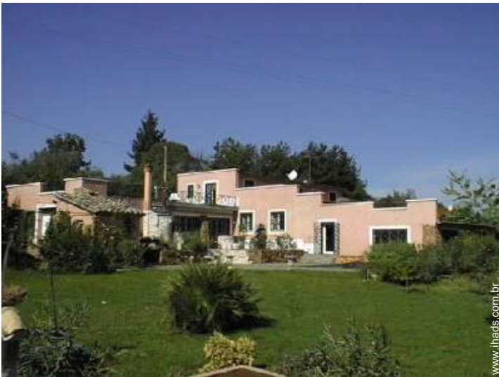
Vivenda de Encanto