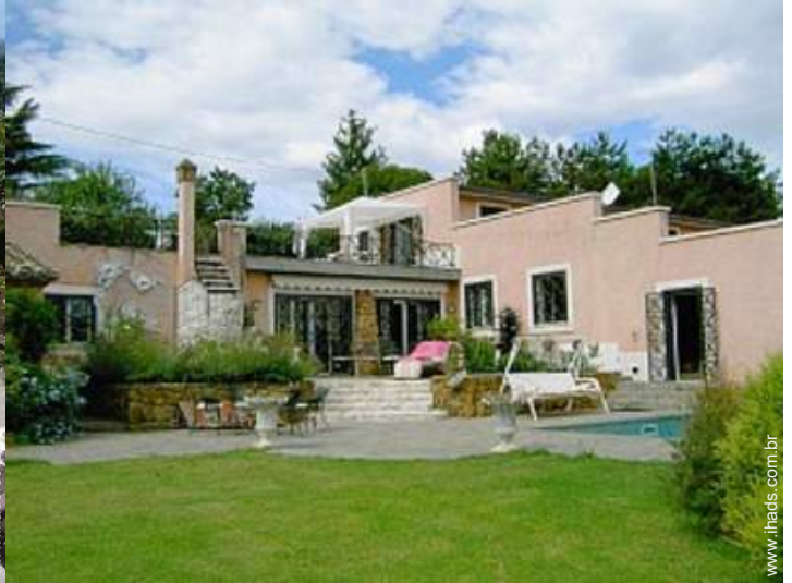
Propriedade de luxo