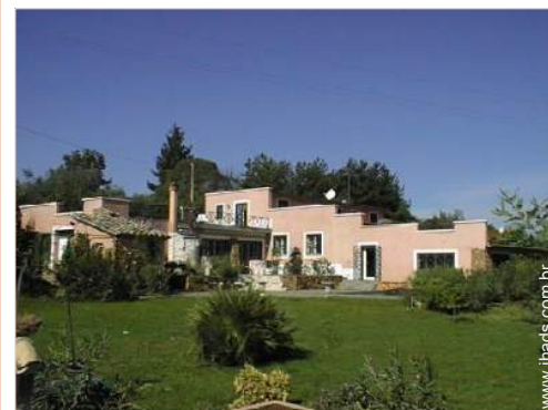
Vivenda de Encanto