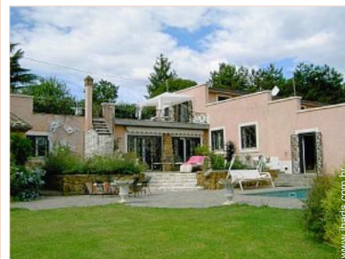
Propriedade de luxo