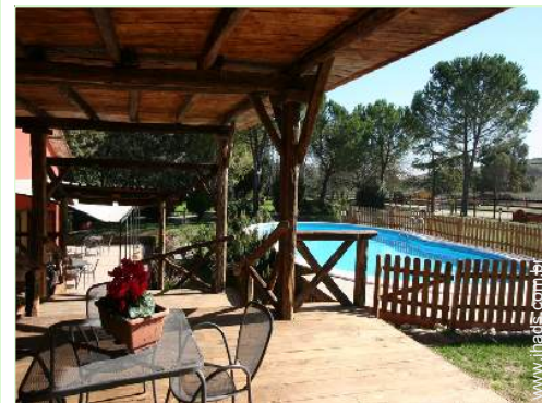
vista a partir da piscina