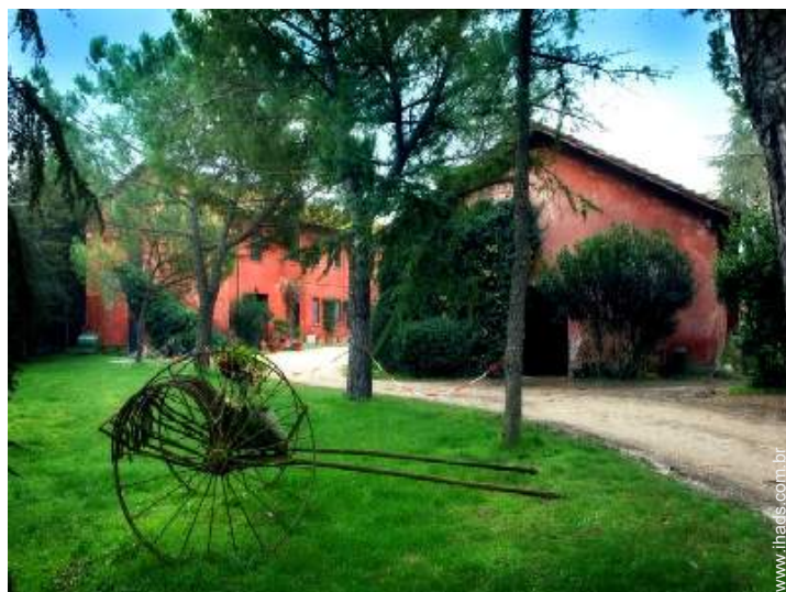
Antiga quinta de Encanto