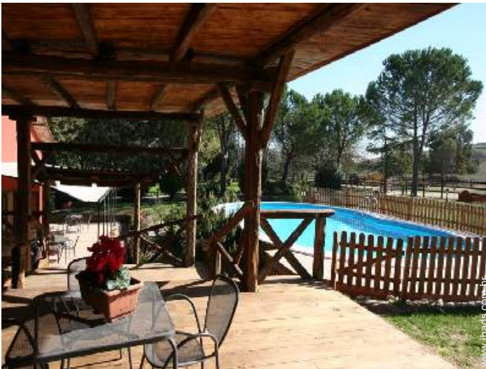
vista a partir da piscina