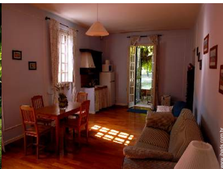
Divisões e comodidades