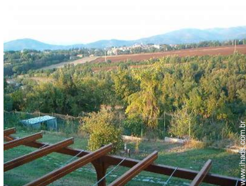
vista sobre vinhas