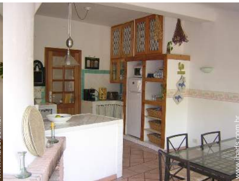
grande cozinha independente