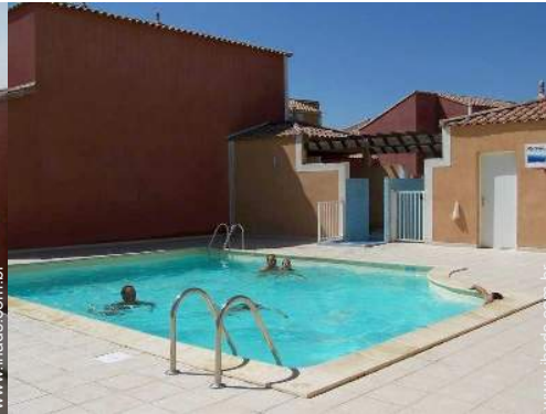
Instalações exteriores à disposição dos hóspedes