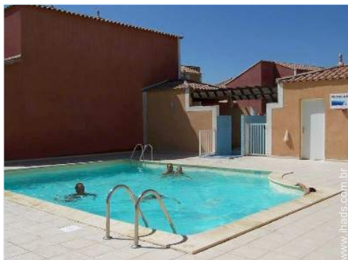
Instalações exteriores à disposição dos hóspedes