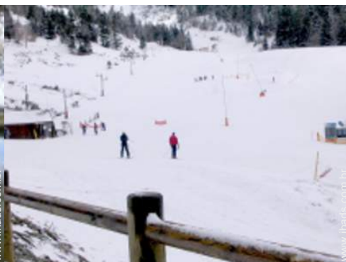
atividades de montanha nas proximidades