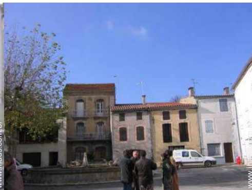
vista centro aldeia