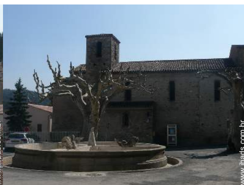
vista centro aldeia