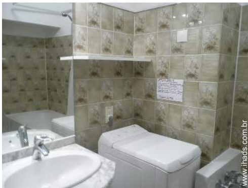
máquina de lavar roupa