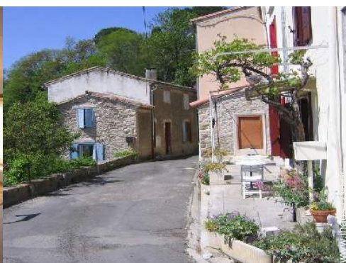
Casinha de campo de Encanto