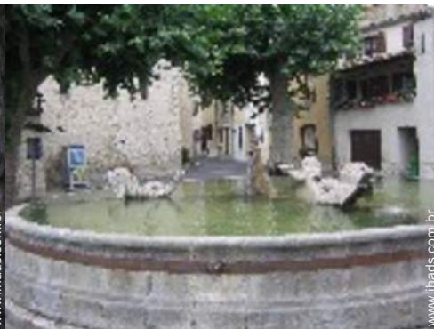
vista centro aldeia