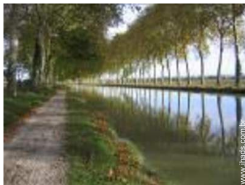
atividades nas proximidades