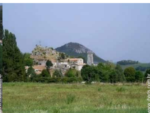
Cidades nas proximidades