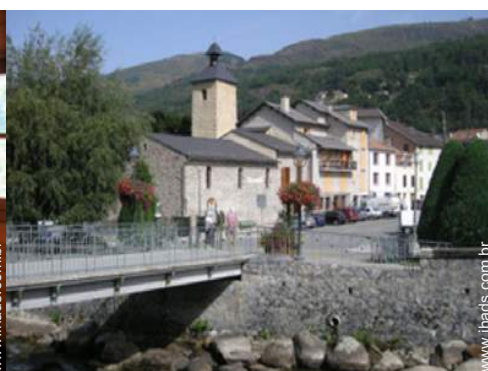
Cidades nas proximidades