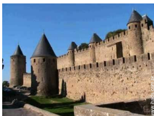
Cidades nas proximidades