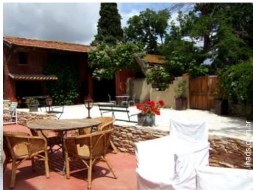
vista de pátio