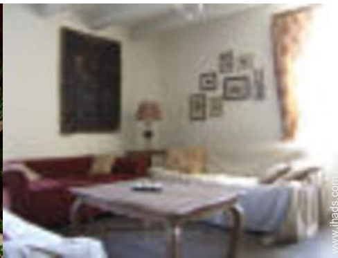
mesa de ping-pong