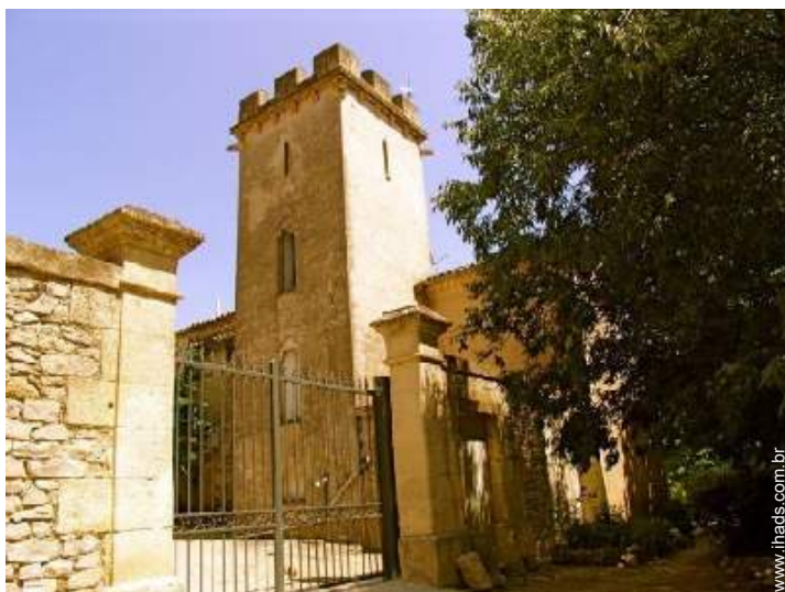
Antigo priorado de luxo