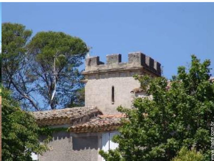
Antigo priorado de luxo