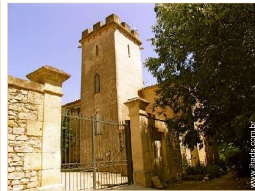
Antigo priorado de luxo