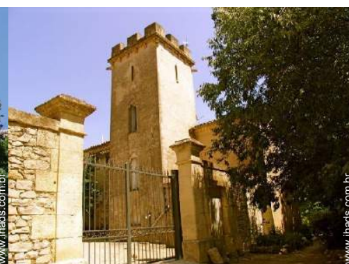
Antigo priorado de luxo