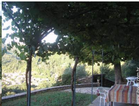
vista a partir do terraço coberto