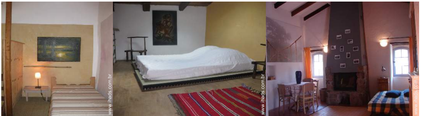
cama(s) futon de casal