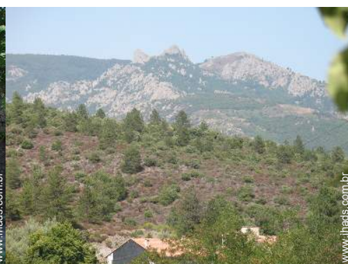
vista de serra