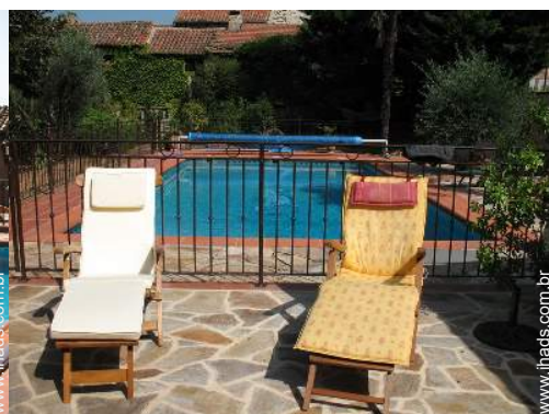
Equipamentos exteriores à disposição dos hóspedes