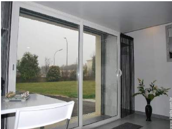
vista a partir da sala de estar