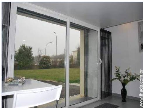
vista a partir da sala de estar