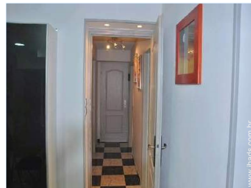
Divisões e comodidades