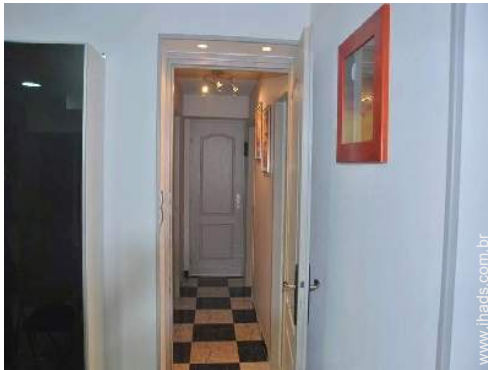
Divisões e comodidades