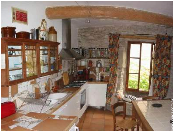
grande cozinha independente