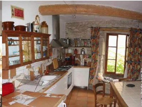
grande cozinha independente