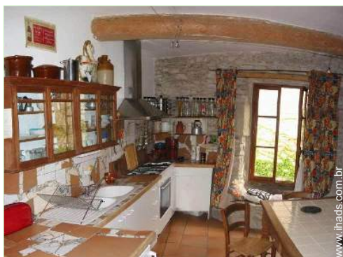
grande cozinha independente