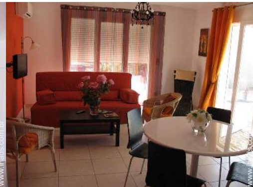
Conforto interior à disposição dos hóspedes