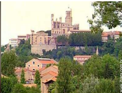
Cidades nas proximidades