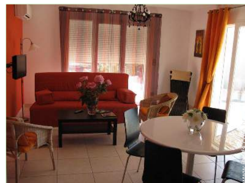
Conforto interior à disposição dos hóspedes