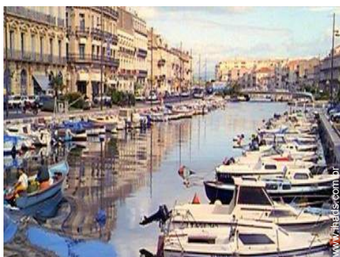
Cidades nas proximidades