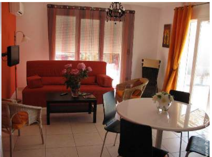
Conforto interior à disposição dos hóspedes