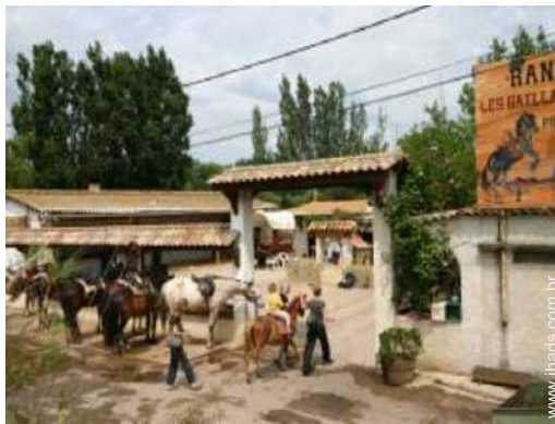
passeio a cavalo