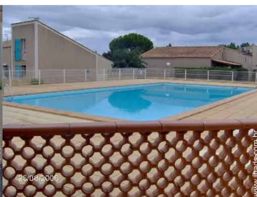
piscina na residência