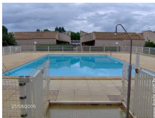
piscina na residência