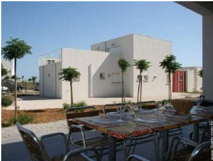
visão de conjunto