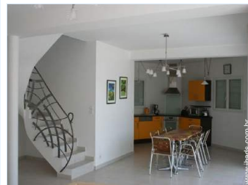
Divisões e comodidades