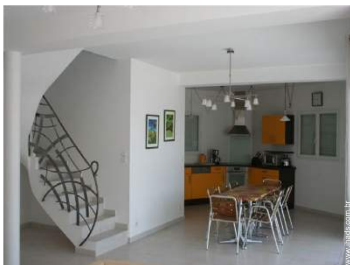
Divisões e comodidades