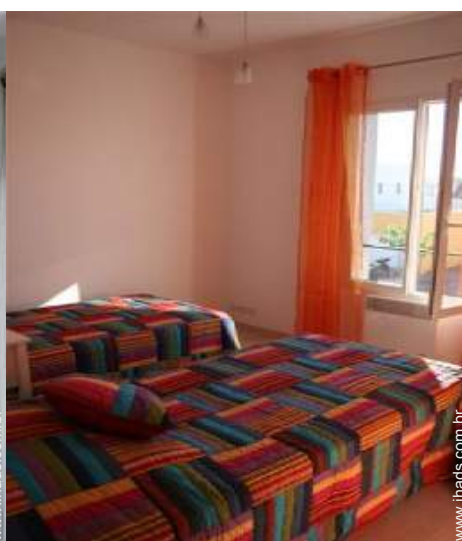
Dormida - cama(s)