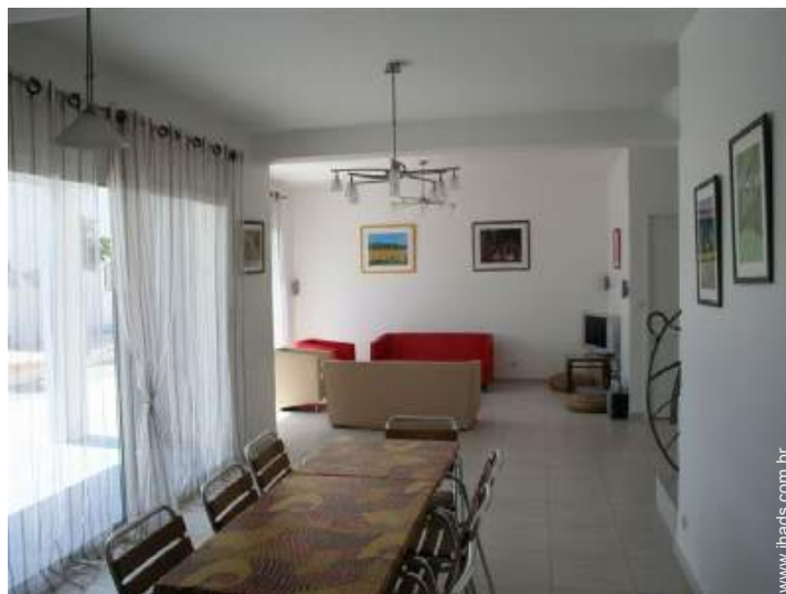
Divisões e comodidades