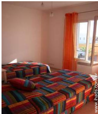
Dormida - cama(s)