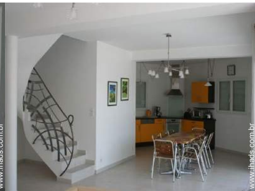
Divisões e comodidades