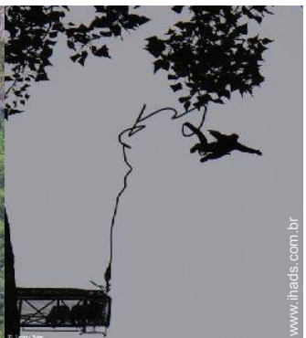
atividades aéreas nas proximidades