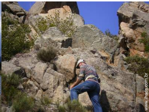
escalada em rocha