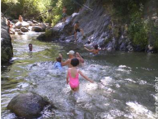
actividades nas proximidades