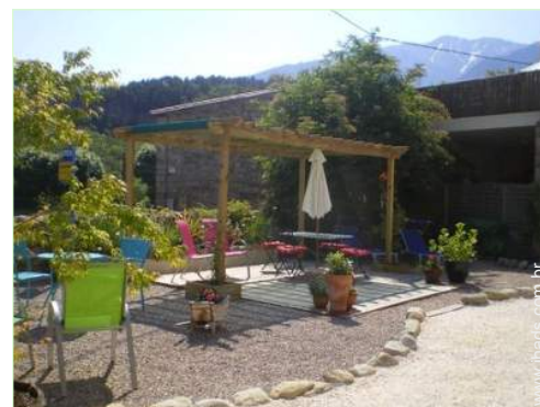
vista de serra