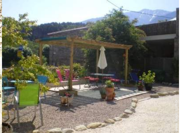
vista de serra