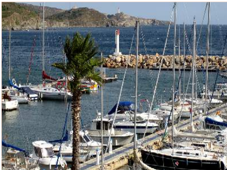
vista sobre o mar