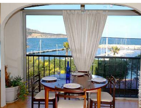
vista de mar