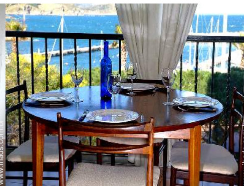
vista sobre o mar