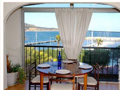
vista de mar