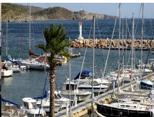
vista sobre o mar