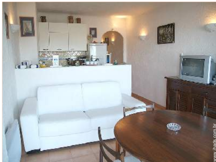
visão de conjunto