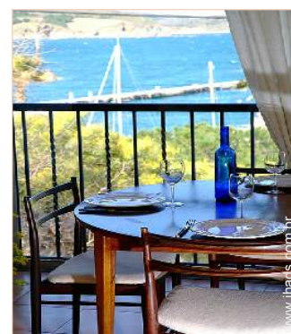
Apartamento de Encanto