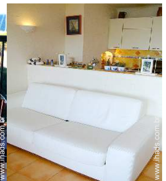
sofá(s) cama 2 pessoas