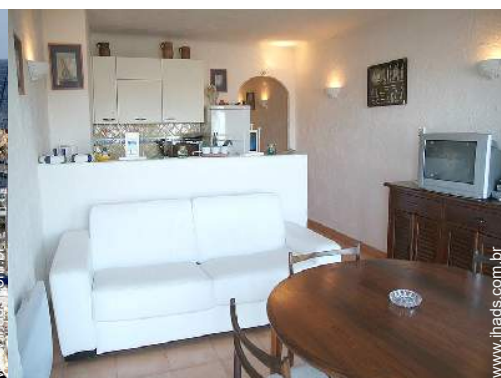
visão de conjunto