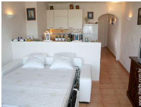
sofá(s) cama 2 pessoas