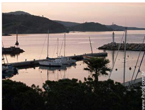
vista a partir da sala de estar