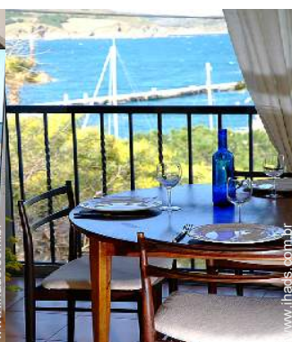
Apartamento de Encanto