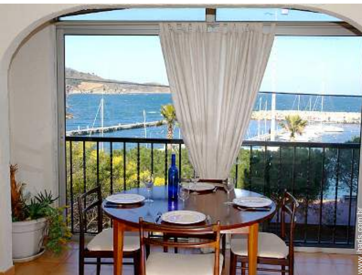
vista de mar