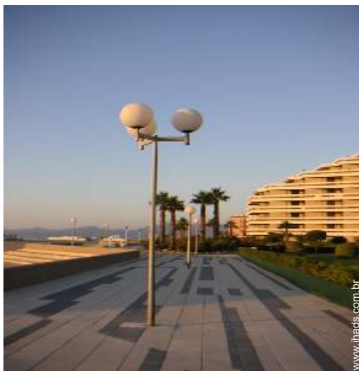
vista rua para peões