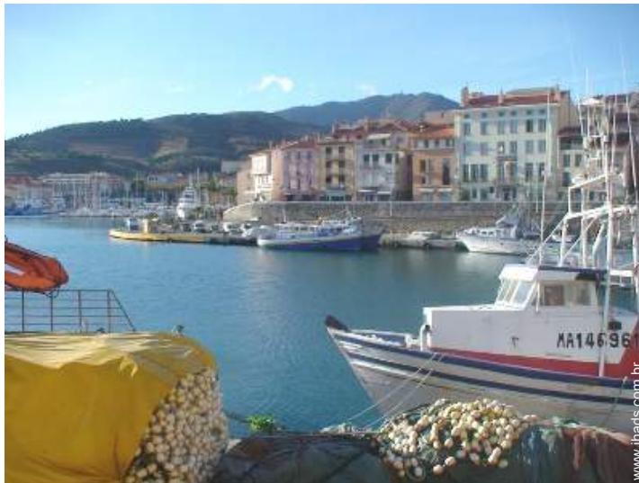
vista de porto