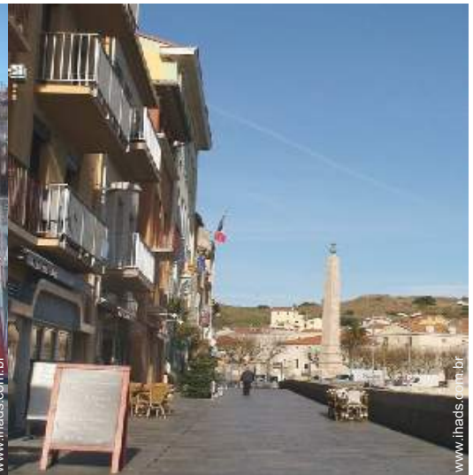
vista rua para peões