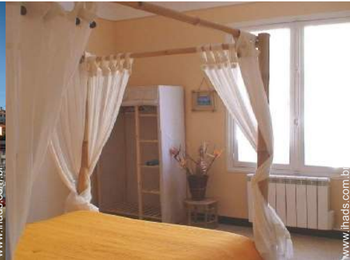
cama(s) de casal com dossel