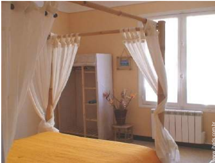
cama(s) de casal com dossel