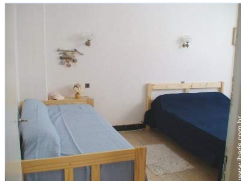
cama(s) convertível/eis dupla(s)

Barbecue, barbecue a gás, mesa(s) de jardim, 6 cadeira(s) de jardim, caramanchão, guarda-sol, salão de jardim, 2 espreguiçadeira(s), 1 cadeira(s) de praia