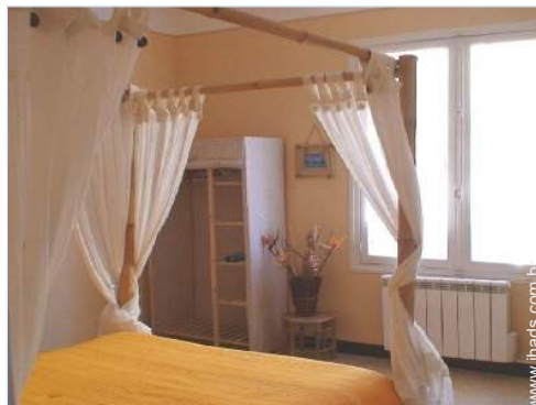
cama(s) de casal com dossel