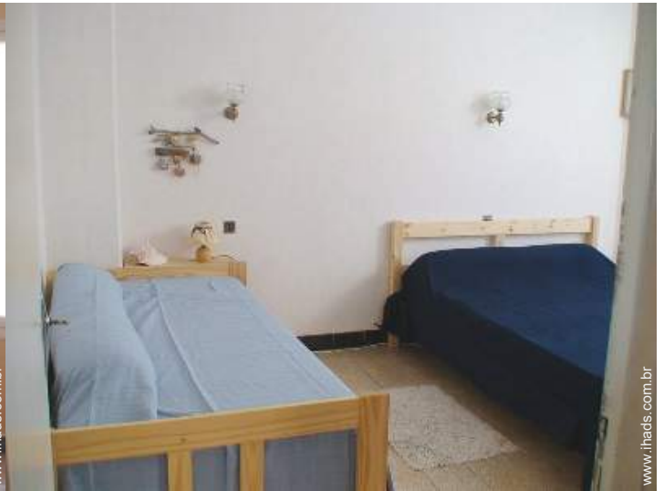
cama(s) convertível/eis dupla(s)