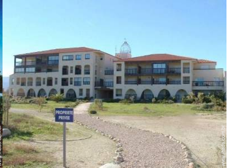
acesso directo à praia