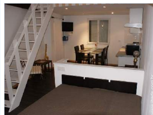
vista a partir do quarto