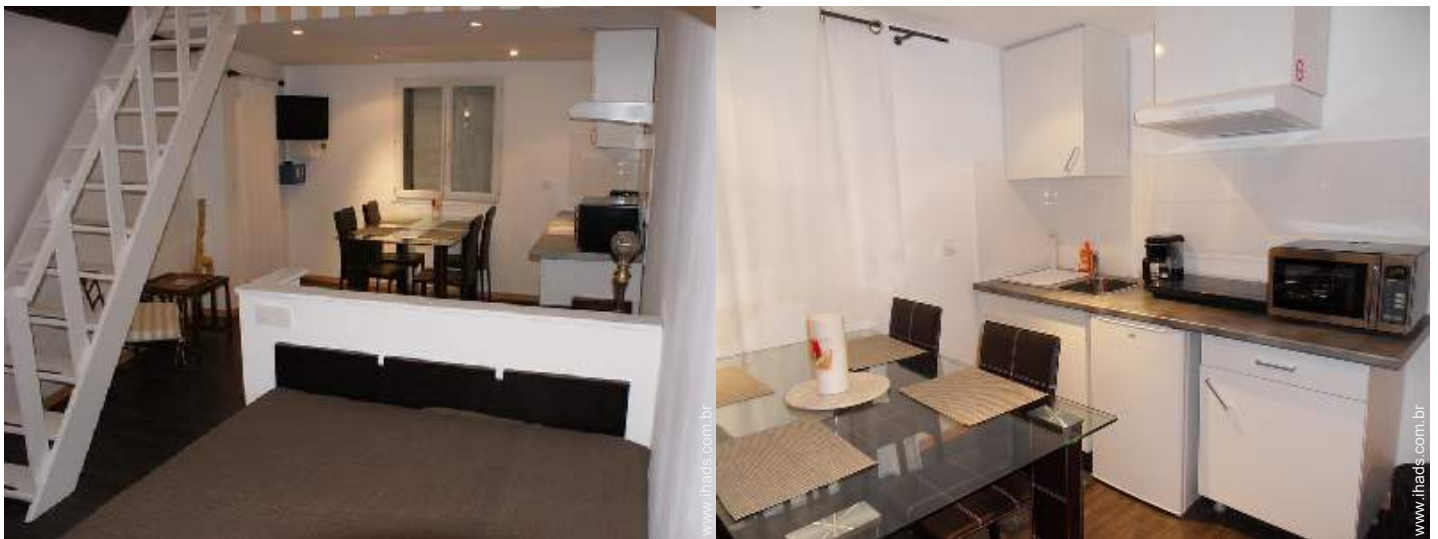
vista a partir do quarto