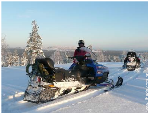
atividades de inverno nas proximidades