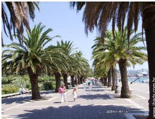
parque e jardim