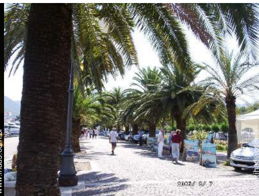
parque e jardim