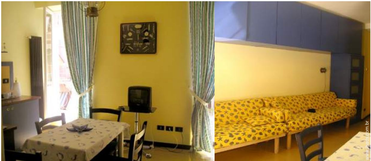
vista a partir da cozinha