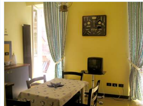
vista a partir da cozinha