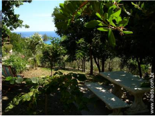
Instalações exteriores à disposição dos hóspedes