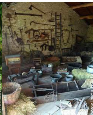
antiguidades &#38; velharias