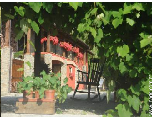
vista de pátio