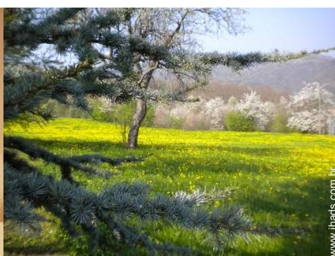
vista a partir do terraço coberto