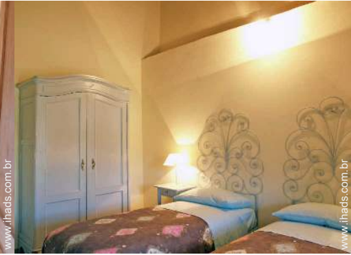
Dormida - cama(s)