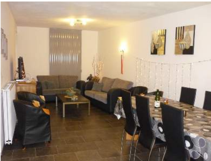
Divisões e comodidades