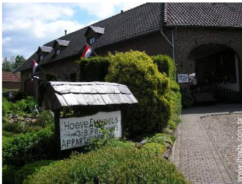
Casa de campo de Encanto