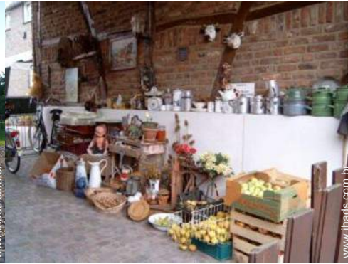
Quintinha de Encanto