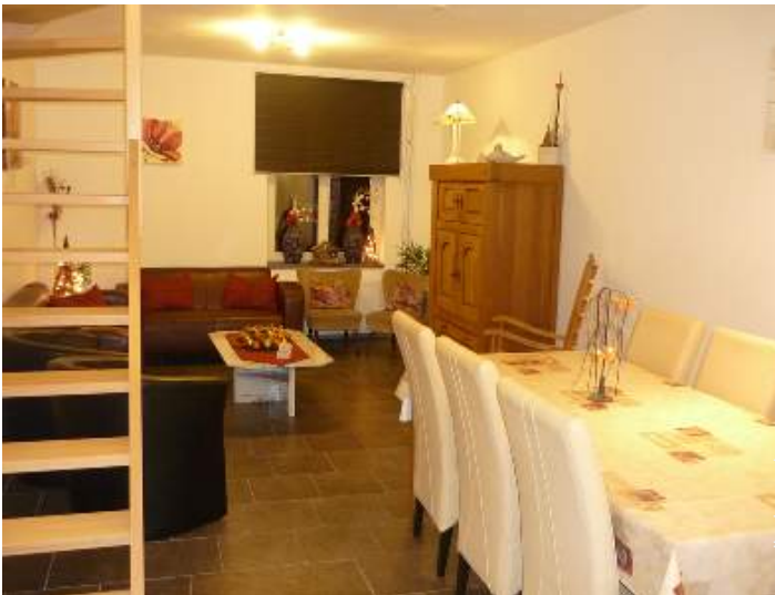
Divisões e comodidades