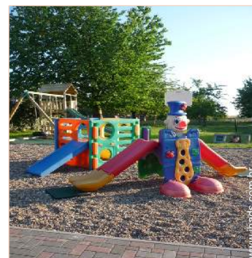
Equipamentos de lazer