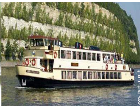
excursão de barco