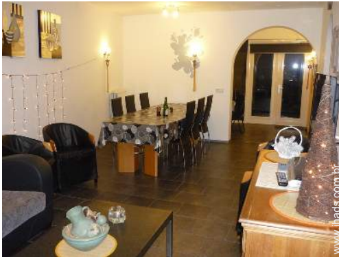
Divisões e comodidades