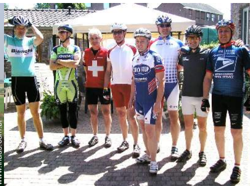
atividades nas proximidades