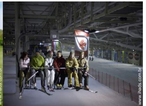
pistas de esqui