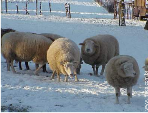
animais da quinta