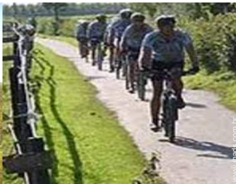
Atracções e lazer