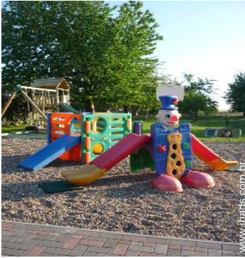
Equipamentos de lazer