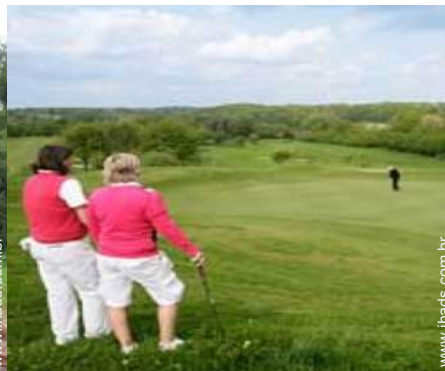
campo de golfe 18 buracos