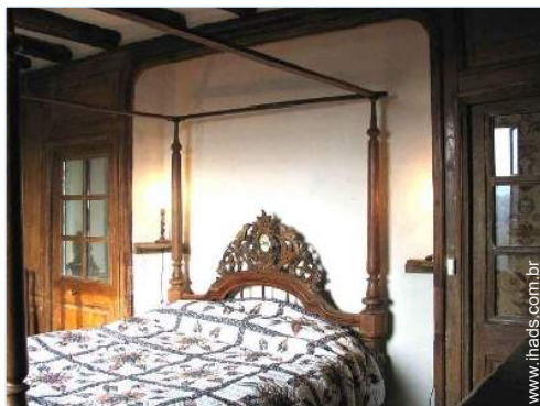
cama(s) de casal com dossel