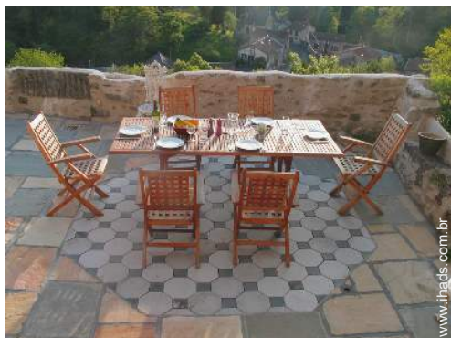
salão de jardim