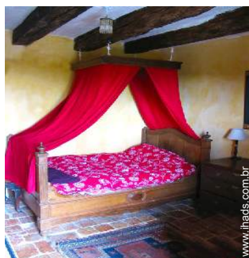
quarto de amigos