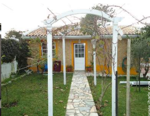
abrigo de jardim