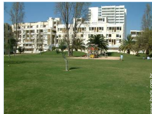
parque e jardim