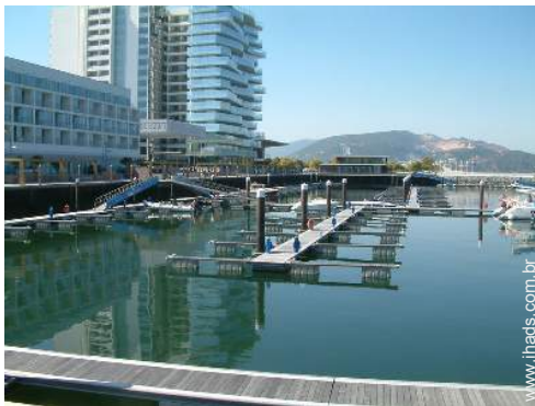
porto de recreio