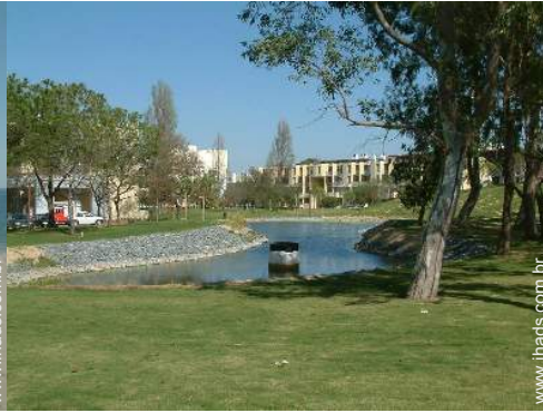
lago de jardim