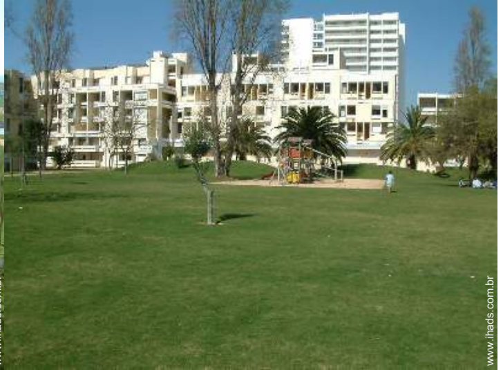
parque e jardim