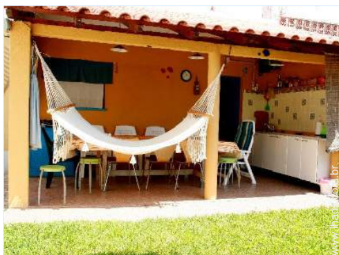
mesa(s) de jardim