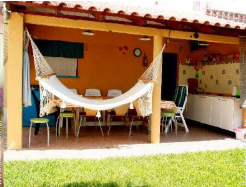
mesa(s) de jardim