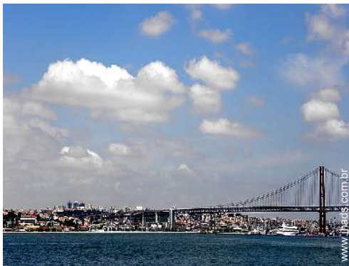
Cidades nas proximidades