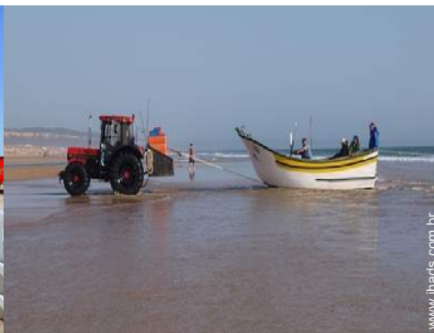
atividades nas proximidades