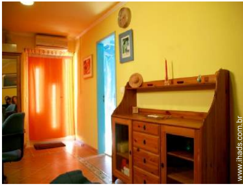
ar condicionado (parcialmente)