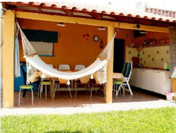
mesa(s) de jardim