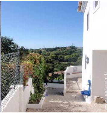
vista a partir do pátio