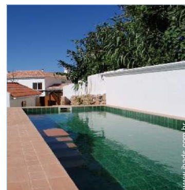
Equipamentos exteriores à disposição dos hóspedes