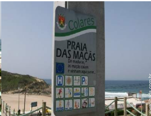
actividades balneares nas proximidades