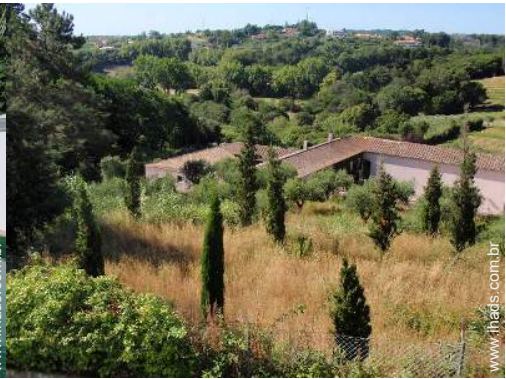
Equipamentos exteriores à disposição dos hóspedes