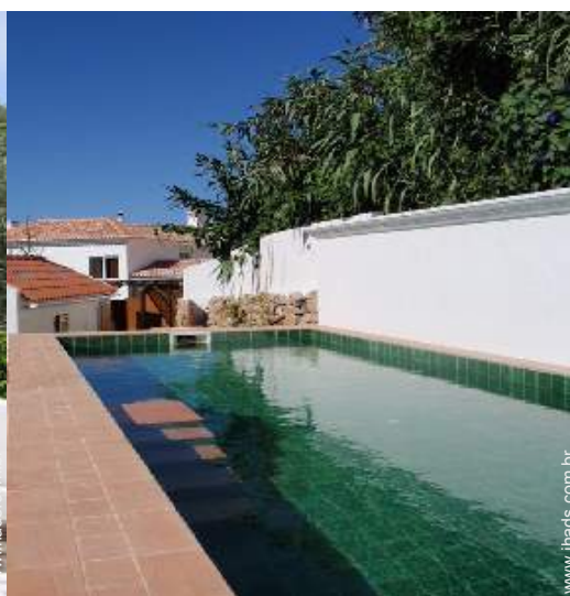
Equipamentos exteriores à disposição dos hóspedes