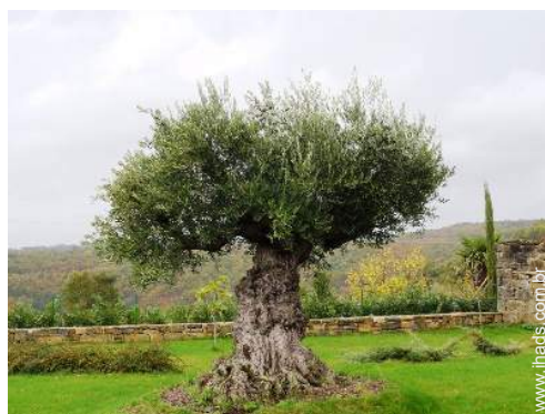
vista de campo