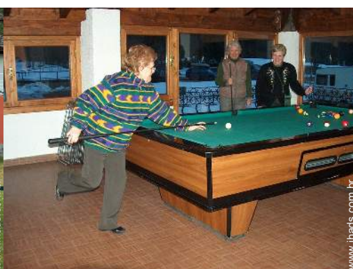
mesa de bilhar