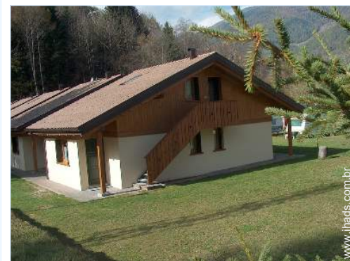
Chalé de Montanha