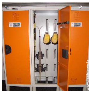
local de esqui