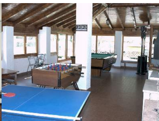
mesa de ping-pong