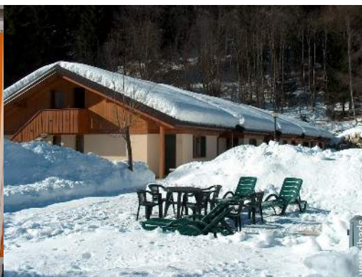
cadeira(s) de jardim