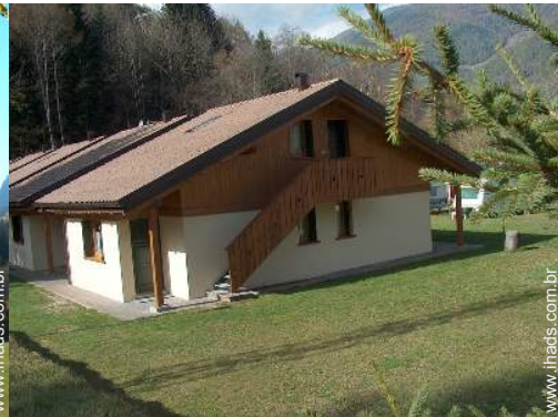
Chalé de Montanha