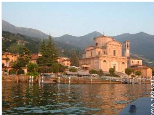
vista centro aldeia