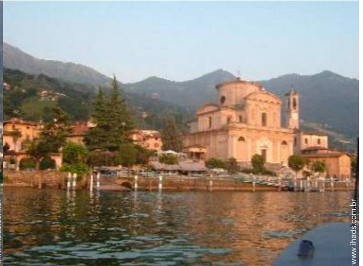
vista centro aldeia