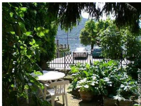
salão de jardim