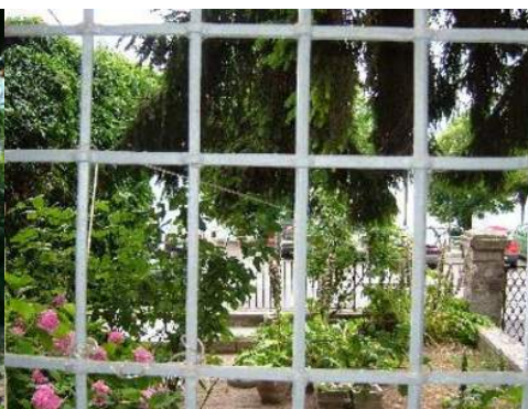
cadeira(s) de jardim