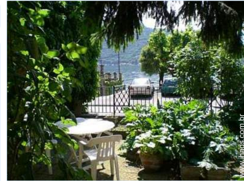
salão de jardim