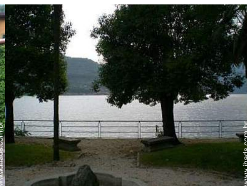
Equipamentos de lazer