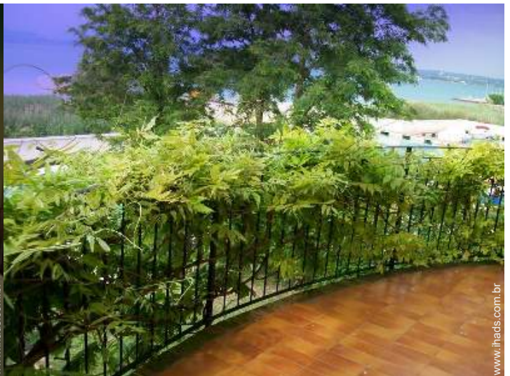
vista a partir do quarto