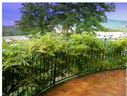
vista a partir do quarto