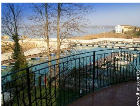
vista de porto