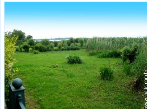
vista a partir do terraço coberto