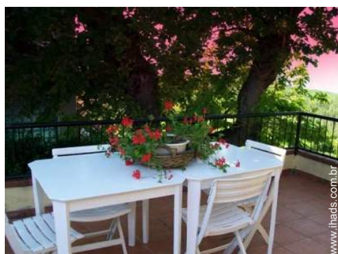
mesa(s) de jardim