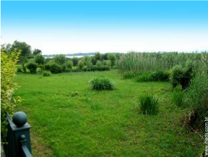
vista a partir do terraço coberto