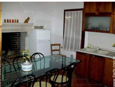
grande cozinha independente