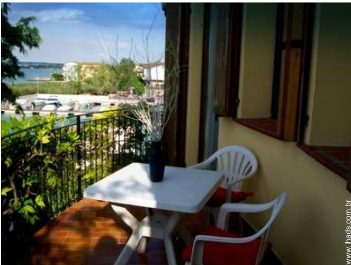
vista de porto