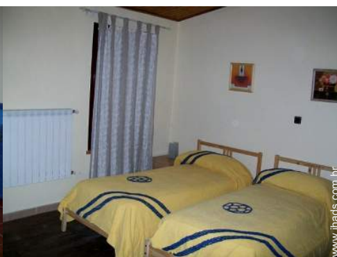
quarto de amigos