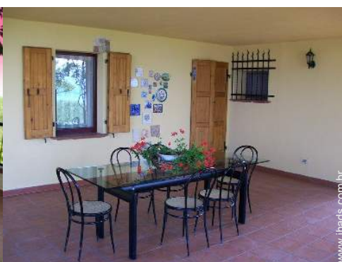
mesa(s) de jardim