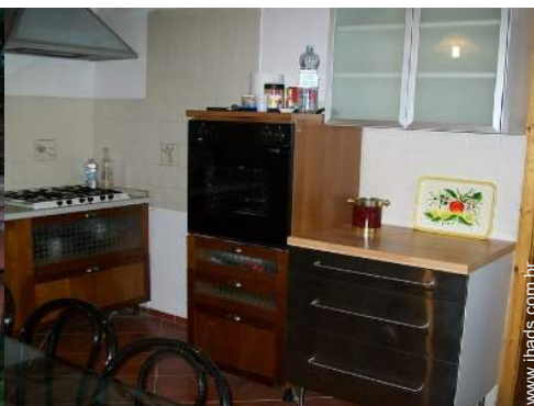
grande cozinha independente