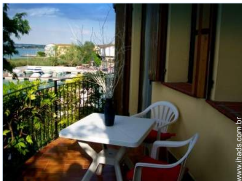
vista de porto