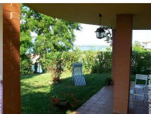
cadeira(s) de praia