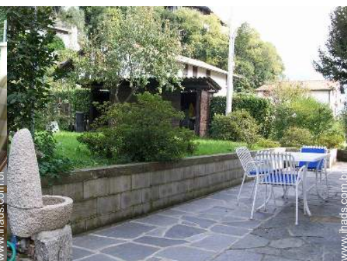
mesa(s) de jardim