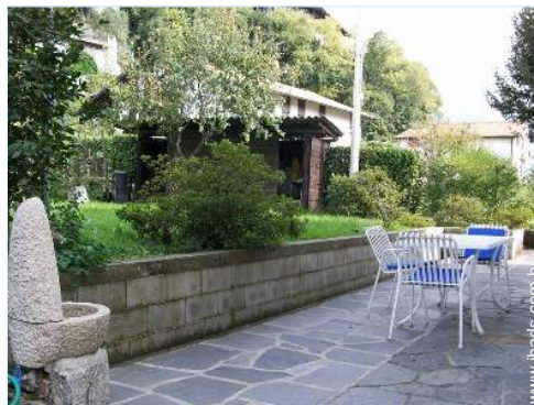
mesa(s) de jardim