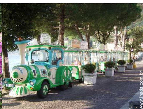
Equipamentos de lazer