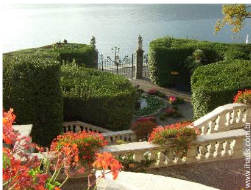
parque e jardim