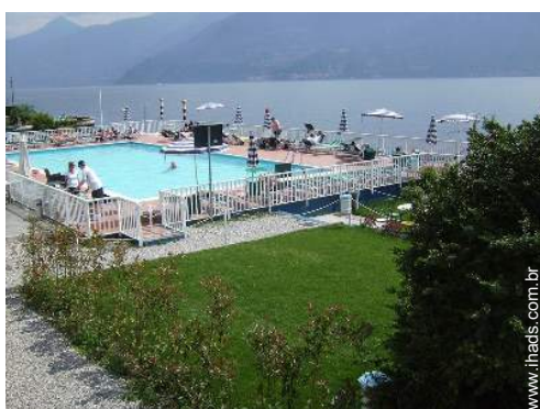
atividades balneares nas proximidades