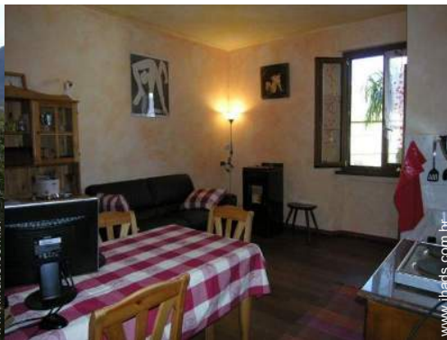
fogão de lenha sueco