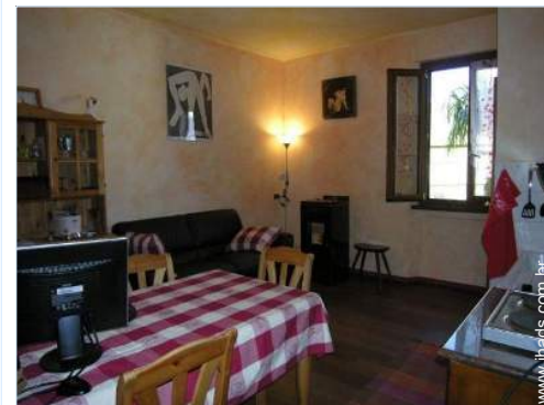
fogão de lenha sueco