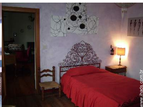
vista a partir do quarto