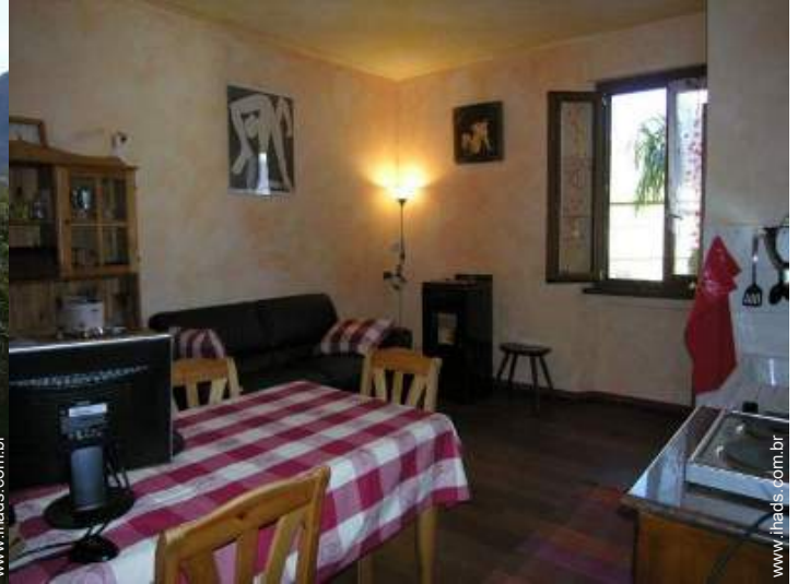
fogão de lenha sueco